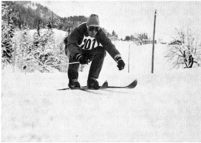
Die Skiabfahrt, eine Disziplin des militärischen Winter-Mehrkampfes, die von allen Teilnehmern Mut, Härte und Durchstehvermögen verlangt.

dieses Schießen in 797 Vereinen mit der Pistole auf 50 m absolvierten. Pro Schütze wurden im Jahre 1962 im Durchschnitt 46 Schuß Gewehrmunition und bei den Pistolenschützen 172 Patronen aufgewendet.