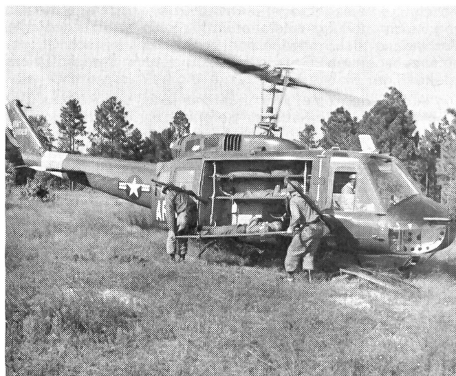
Verwundete werden in den Bell-HU-1B «Iroquois» eingeladen und zurücktransportiert.