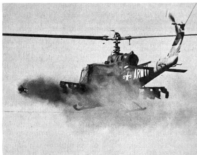
Der schwere amerikanische Hubschrauber Bell HU-1B «Iroquois» beim Abfeuern von Panzerabwehrraketen, drahtgesteuert, vom Typ SS-11 «Cobra».