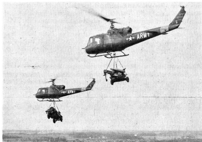
Die Lenkwaffe «Little John» wird mittels des Hubschraubers «Iroquois» in das Einsatzgelände transportiert. Dieser Hubschrauber vermag etwa 2 Tonnen aufzunehmen.