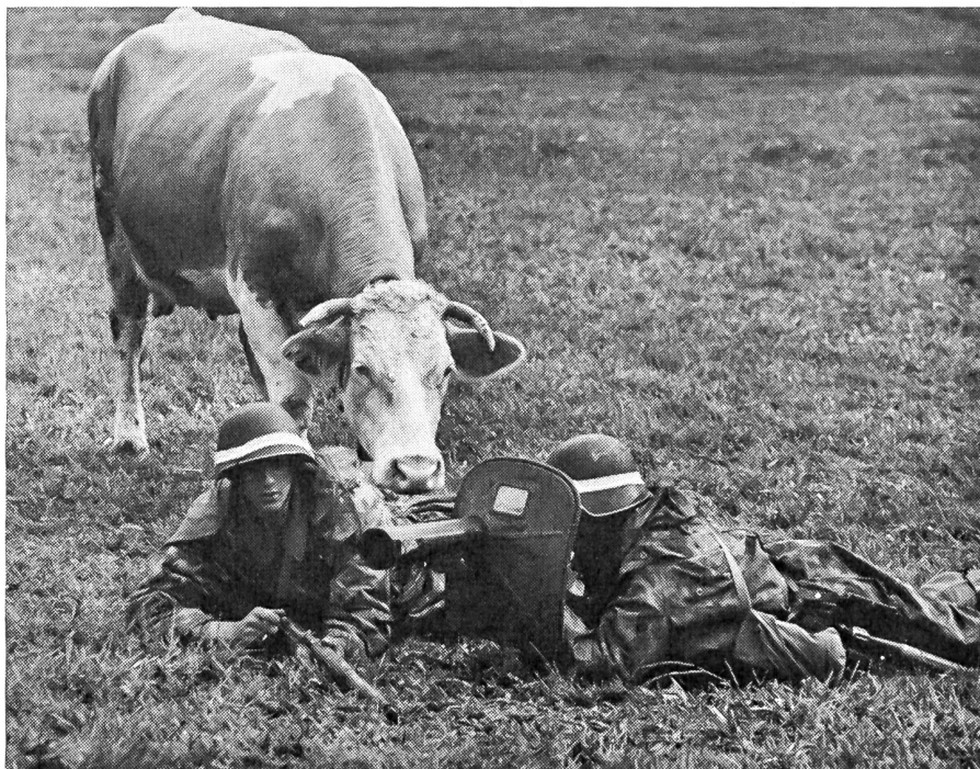
«Der unfreiwillige Humor kommt auch im Gefechte vor!»