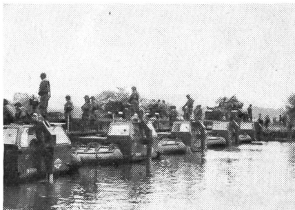
Übergang über die Meuse bei den «Falaises de Dun». Die Aufnahme vermittelt ein eindruckliches Bild über die modernen Geniemittel, die zum Einsatz kamen.