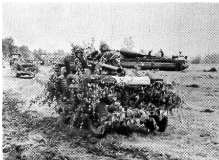
Mobile, getarnte Panzerabwehrwaffen warten auf den Einsatzbefehl.