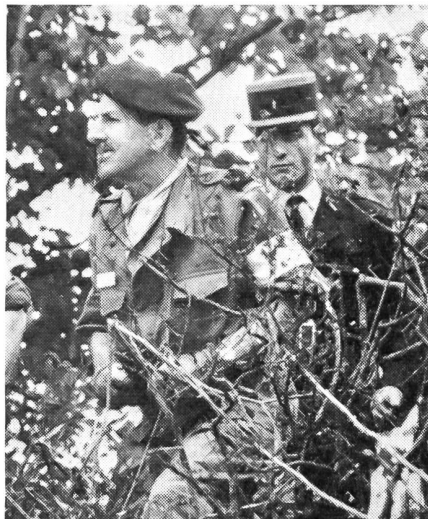
General Massu, Militärgouverneur der Region Metz, war Chef der blauen Truppen. Unser Bild zeigt den kühnen Fallschirmjärgergeneral (links) in einer für ihn charakteristischen Pose.

Unter dem Stichwort «Valmy» führten die französischen Streitkräfte unlängst großangelegte und kombinierte Manöver durch. Keystone-Press stellte uns Bilder zur Verfügung, die uns interessante Einblicke in die Bewaffnung und Ausrüstung unseres westlichen Nachbarn gewähren.