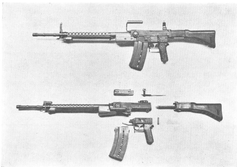
Das Sturmgewehr – die persönliche Waffe des Einzelkämpfers

Hiermit möchte ich ab sofort Ihre Zeitung «Der Schweizer Soldat» abonnieren. Bis jetzt kaufte ich diese Zeitung an Kiosken, und ich habe mich davon überzeugt, daß es eine der besten Zeitschriften ist, denn es ist in jeder Nummer viel Wissenswertes enthalten. Oblt. C. in Sch.