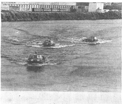
2. Testfahrt der sogenannten Larc-Amphibienfahrzeuge im Wasser, deren Steuerung hydraulisch erfolgt; für den Fall einer technischen Störung ist ein mechanisches Steuer eingebaut.