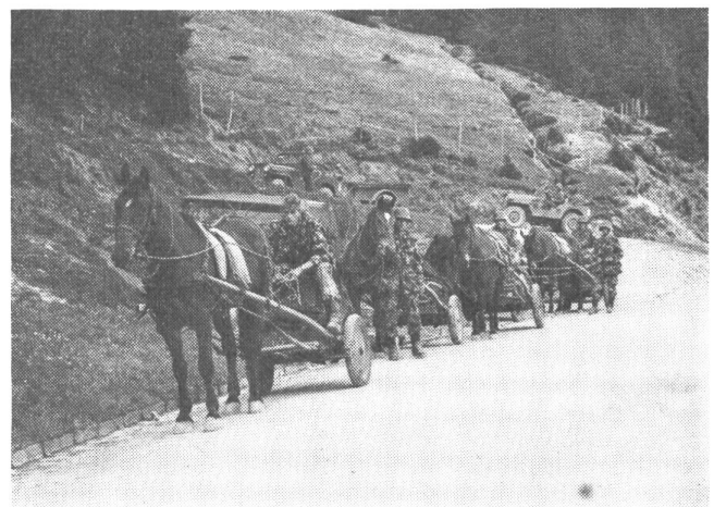
Trainkolonne während eines Haltes