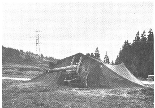
15 cm Haubitze (Sch.Hb.42) Waffengewicht: ca. 6500 kg Transport: Motorzug mit Lastwagen (Geländewagen)