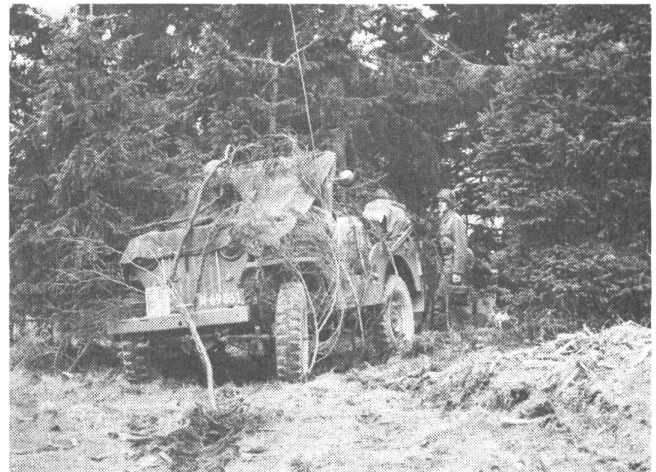
Behelfsmäßig getarnter Jeep