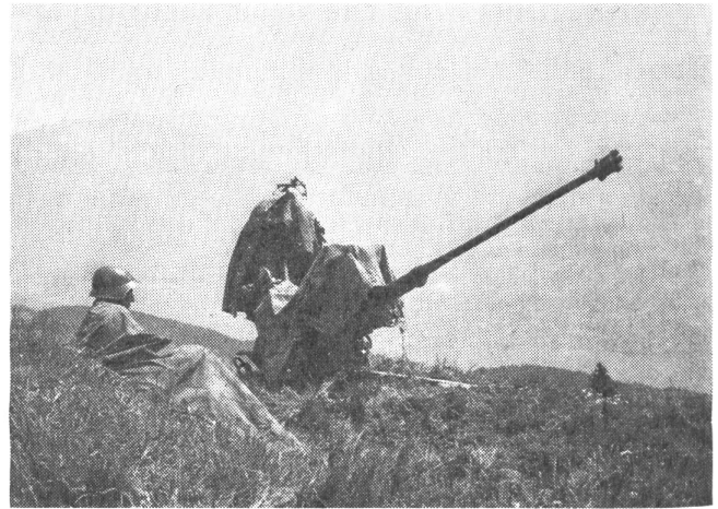
20 mm Fliegerabwehrkanone Modell 1954 Einsatz gegen Flugzeuge sowie gegen leicht gepanzerte Fahrzeuge bis 1500 m Entfernung. Trommelmagazin. Schußfolge 1000/Min.

Das Mat.Bat. 5, neu gebildet durch die TO 61, war als solches zum ersten Male im Dienst. Seine Leistungsfähigkeit ist in dieser Uebung erprobt worden. Durch den Einsatz von Fachschießrichtern wurden Materialrückschub und Reparaturen nötigenfalls provoziert. Da die rückwärtigen Formationen der Gz.Div. 5 erstmals