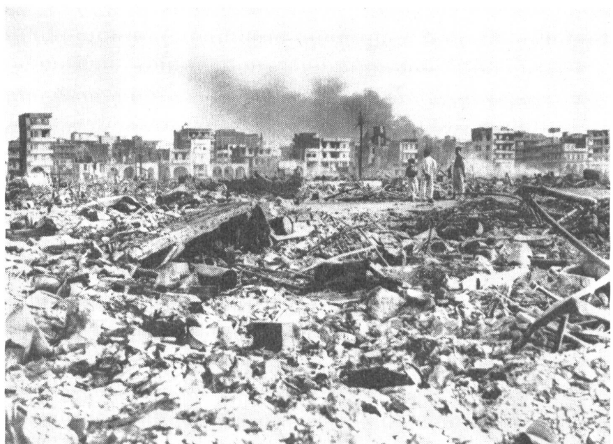
Das Gesicht des Krieges

Vom Aufgebot von Truppen zum aktiven Dienst ist zu unterscheiden die formelle Erklärung des «Aktivdienstzustandes» . Die zahlreichen rechtlichen, politischen und militärischen Konsequenzen des Aktivdienstes sollen nicht schon beim ersten Aufgebot von Truppen zum aktiven Dienst eintreten. Unbestritten ist dies dort, wo nur kleine Verbände zu Anlässen rein lokaler Art aufgeboten werden, wie Ehrentruppen für einen Staatsakt, Räumungstruppen für eine örtliche Naturkatastrophe oder Ordnungstruppen für eine lokale Unruhe. Erst wenn das Aufgebot größeren Umfang hat und wenn der Staat in seiner Gesamtheit in Gefahr ist, wird man die einschneidenden Konsequen-