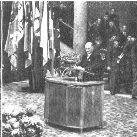
Der Chef des Eidgenössischen Militärdepartements, Bundesrat Paul Chaudet, überbrachte den Unteroffizieren den Dank und die Anerkennung der Landesregierung.