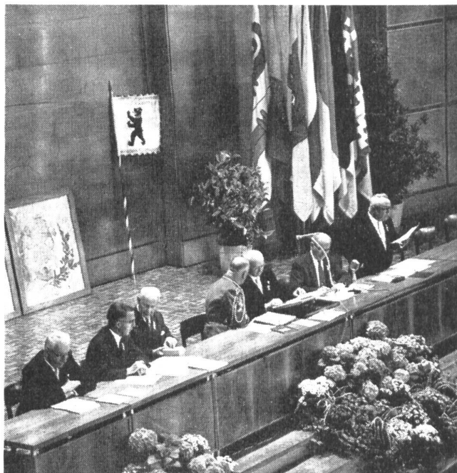
Die Obmannschaft der Veteranen-Vereinigung des SUOV während der Verhandlungen ihrer 19. Tagung in der Aula der Universität Freiburg.