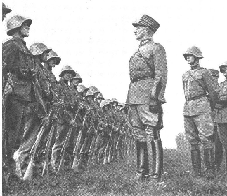
General Guisan inspiziert eine Einheit

«Soldaten! Am 1. August 1940 werdet ihr euch vor Augen halten, daß die neuen Stellungen, die ich euch zugewiesen habe, diejenigen sind, wo eure Waffen und euer Mut sich