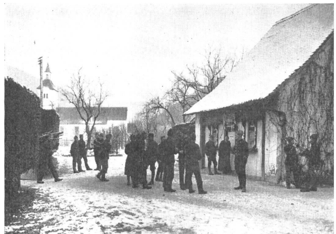
Soyhières — eine der ersten Soldatenstuben, mit denen der Mangel an geeigneten Aufenthaltsräumen für unsere Soldaten im Ersten Weltkrieg energisch zu Leibe gerückt wurde

Während des Ersten Weltkrieges wurden rund tausend Soldatenstuben geführt, im Mai 1917 waren 178 Stuben gleichzeitig in Betrieb, die höchste Zahl, die in einem Monat erreicht wurde. Die Idee, einen angenehmen Aufenthaltsraum zur Verbringung der Freizeit und einen Ort der Begegnung an neutraler Stelle zu schaffen, hatte sich erfolgreich durchgesetzt. Im Zweiten Weltkrieg wurden die