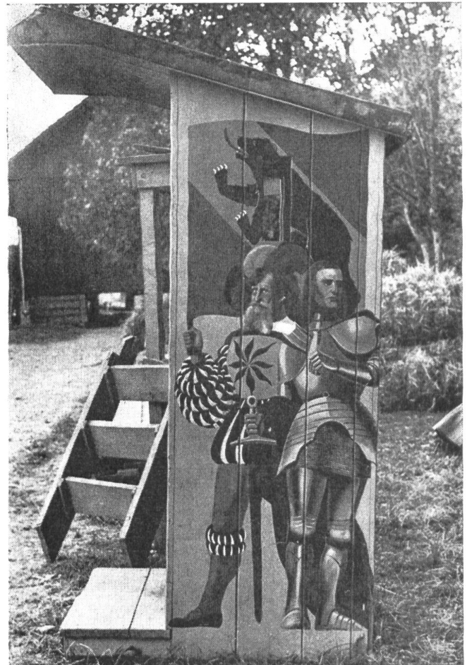
Solch bunt geschmückte Schildwachhäuschen hat die Truppe im Zweiten Weltkrieg vielerorts aufgestellt

So verschieden sich die einzelnen Soldatenstuben auch präsentieren mögen, im Steinhaus oder in einer Baracke, etwas ist allen gemeinsam: der Soldat findet hier ein Zuhause. fk