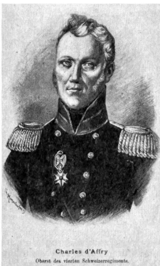
Charles d'Affry Oberst des vierten Schweizerregiments.