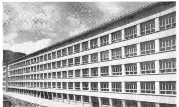
Teilansicht der Paillard-Werke