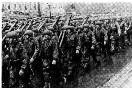
Vorbeimarsch der Grenzschutzkompanie Leonfelden des österreichischen Bundesheeres anlässlich der großen Parade in Wien.

Der Berichterstatter nahm einige Tage später in Wien an den Feierlichkeiten zum 20. Jahrestag der Zweiten Republik Oesterreich teil, welche den Auftakt zum 10. Jahrestag der Unterzeichnung des Staatsvertrages bildeten, der unserem Nachbarland im Osten nach leidvollen Zeiten der Besetzung 1955 die volle Souveränität zurückgab. Den Höhepunkt der Feierlichkeiten bildete am 27. April die seither größte Parade des Bundesheeres, das mit 6000 Mann, 568 Fahrzeugen und Panzern und 80 Flugzeugen über den Ring vor dem Parlament zog und mit allen Waffengattungen ein eindruckliches Bild der Wehranstrengungen der letzten zehn Jahre vermittelte. Der «Schweizer Soldat» wird im Herbst in einer Sondernummer zum 10jährigen Bestehen des österreichischen Bundesheeres über