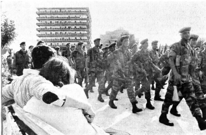
Die Fallschirmtruppe: Kein Schreckgespenst für Bürger in Zivil.

gehen voran — im Frieden wie in der Schlacht. Sie schicken die Männer nicht vorwärts. Sie gehen vor — die Männer folgen. Im Sinai-Feldzug 1956 zeigte sich, daß die Verluste an Offizieren unverhältnismäßig hoch waren. Ein Wort zur Wehrpflicht: Nach dem Gesetz von 1949 wurden junge Männer zwischen dem 18. und 26. Lebensjahr für zweieinhalb Jahre, ältere zwischen 27 und 29 Jahre für zwei Jahre eingezogen. Danach gehören sie bis zum 49. Lebensjahr der Reserve an. Ledige Frauen zwischen 18 und 26 mußten 24 Monate dienen; es sei denn, sie beantragten aus religiösen Gründen Befreiung vom Wehrdienst. Eine Heirat bedeutet für die Frau das Ende des aktiven Dienstes. Ist sie Mutter, braucht sie auch keine Reserveübungen zu machen. Kinderlose Frauen müssen bis zum 34. Lebensjahr auf den Grundsatz «Reserve hat Ruh» verzichten. Weil sich die Jahrgänge vergrößerten, wurde 1963 auf dem Verordnungswege die Dienstzeit für Männer und Frauen um je vier Monate gekürzt. Die Armee ist «Schule der Nation» Sie könnte das nicht sein, gäbe es nicht Schulen in der Armee. Eine dieser Schulen, wohl die hervorstechendste, habe ich besucht: die «Marcus-Schule» in der großen Hafenstadt Haifa. Sie ist benannt nach einem amerikanischen Offizier, der im israelischen Unabhängigkeitskrieg fiel. Major Ziv leitet die Schule. Er strahlt Güte aus, er fühlt sich jedem seiner