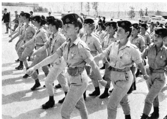
20 Monate müssen Israels Mädchen in der Armee dienen. Doch nur bei Paraden, wie hier in Jerusalem, marschieren sie in geschlossener Formation.