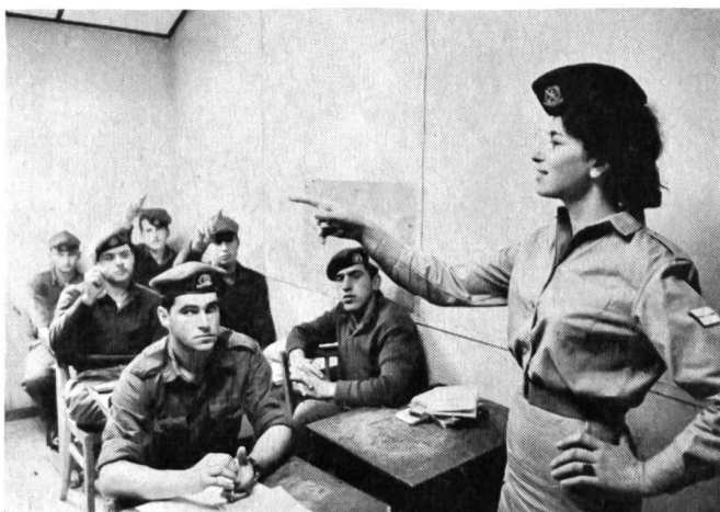
In der Militärschule von Haifa sitzen harte Krieger respektvoll vor einer jungen Lehrerin. Sie gibt Einwanderern aus allen Ländern Unterricht in Hebräisch.

Ein anderer Grund: Mädchen in Uniform werden während ihrer Dienstpflicht bevorzugt als Lehrerinnen eingesetzt. Sie lehren Hebräisch, die Staatssprache, sie bringen Analphabeten aus dem Jemen und Marokko das Lesen und Schreiben bei; sie runden bei anderen die nicht beendete Volksschulbildung ab. Noch etwas spricht aus israelischer Sicht für den Militärdienst der Frauen: die psychologische Bedeutung. Die jungen Einwanderer aus orientalischen Ländern, die die Gleichberechtigung von Mann