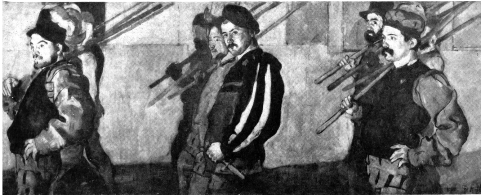
Ferdinand Hodler «Le Cortège»

des keinen abgang habent, und sobald einer also umbkumpt, sol man die kinde wie vorstat bevogten, und von stund an solich guot in geschrift nemmen, darumb jerrlich rechnung geben, mit guoten trüwen und ungefarlich.