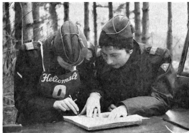
Die Vielseitigkeitskonkurrenz bereitet den beiden Fahrerinnen etwelches Kopfzerbrechen.