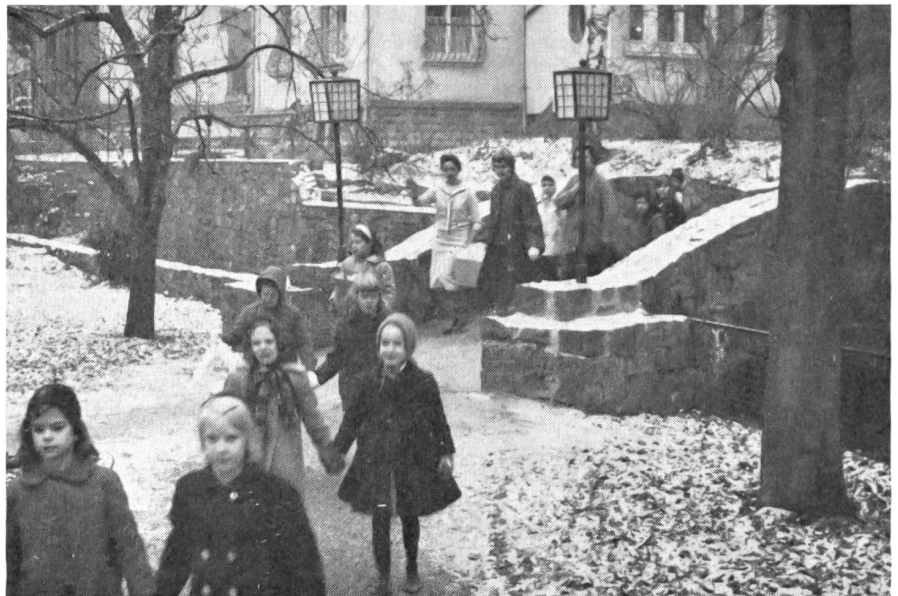
Waisenkinder gehen zu einer Weihnachtsfeier.