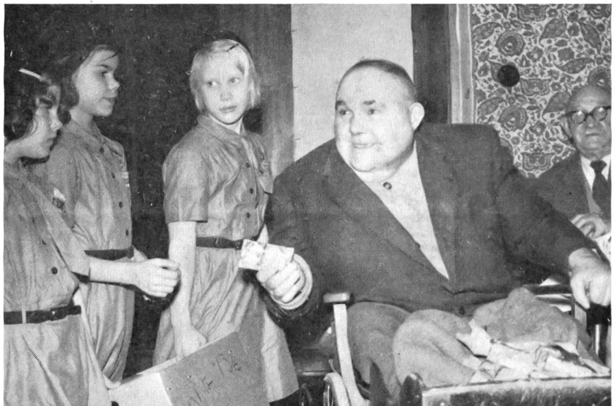
Geschenke für alte, gebrechliche Leute.