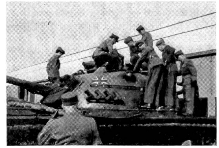
Im Sturm wird der M 48 (Patton) genommen

Anschließend daran erklärte uns der Stv.Kdt. des Pz.Bat. 294, Major Kuschel, die Gliederung und Ausrüstung eines Pz.Bat. Wer nicht gerade bei den leichten Truppen eingeteilt ist oder einen entsprechenden Grad bekleidet, kann sich kaum vorstellen, was für Material einer solchen Einheit zur Verfügung steht, wie sie sich zusammensetzt und mit was für Schwierigkeiten (Nachschub, Ersatzteile,