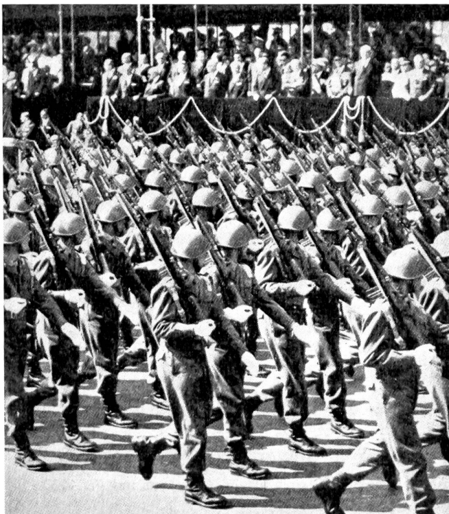
◀ 1. Regiment «Grenadiere aus Sardinien»

Zur Intensivierung der Ausbildung bestand auch durch die Verkürzung der Wehrdienstzeit von 18 auf 15 Monate ein indirekter