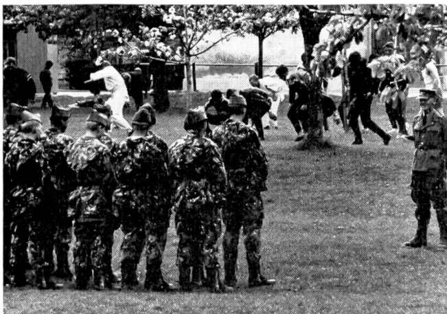
Unsere Bilder zeigen, daß militärische Ausbildung und sportliches Training sehr wohl auf einen Nenner zu bringen sind und sich ausgezeichnet ergänzen.