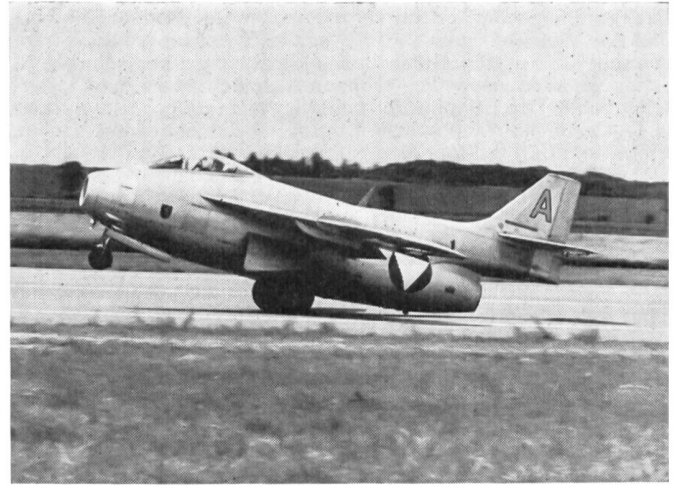
Jagdbomber SAAB J 29 F, genannt «Fliegende Tonne»