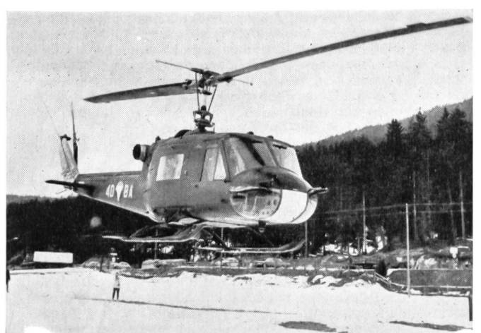
Hubschrauber Bell 204 B