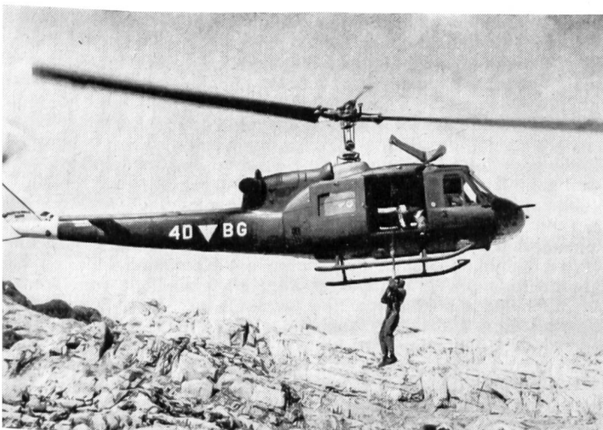
Hubschrauber Bell 204 bei einer Bergung im Gebirge