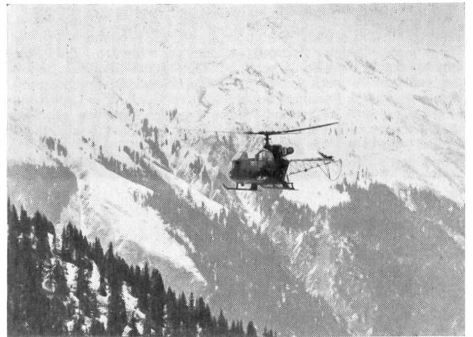
Hubschrauber Alouette II