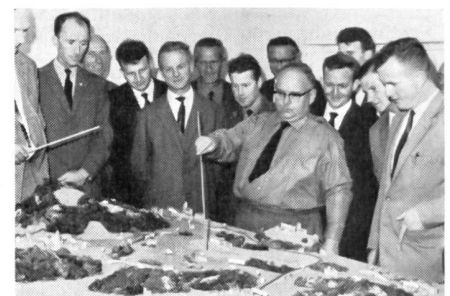
Einige Kameraden der Sektion am Sandkasten. Die eigentliche Leistung am Sandkasten ist eine Denk- und Sprechübung. Lebendiges Vorstellungsvermögen, rasche Auffassungsfähigkeit, logisches Kombinieren und Schlußfolgern, Entschlußfreudigkeit und vollständiges, klares und mitreißendes Befehlen sind die Disziplinen, in denen sich der Uof. an einem Gelände-modell übt. Mit ihrer Beherrschung gewinnt er die Sicherheit des Auftretens und das dem Führer nötige Vertrauen von Vorgesetzten und Untergebenen.