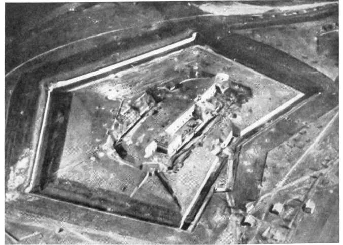
Januar 1916. Fliegeraufnahme vom Fort Douaumont vor der Schlacht von Verdun.