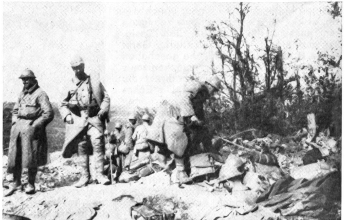
September 1916. Französische Soldaten durchsuchen nach der Zurückeroberung der «Höhe 304» einen verlassenen deutschen Schützengraben.