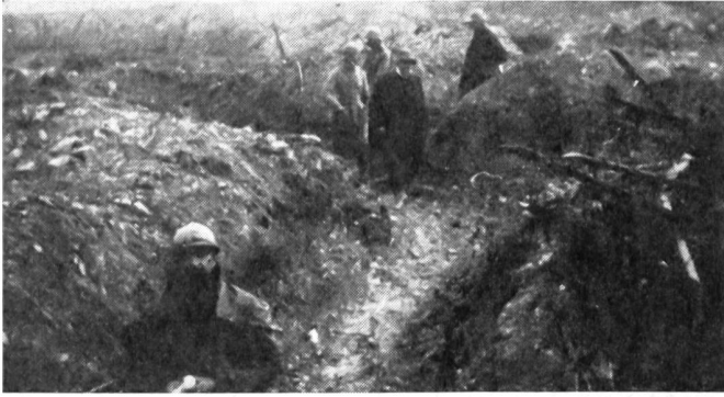
Frühjahr 1917. Georges Clémenceau, damals französischer Ministerpräsident, auf Besuch an der Front. Das Bild zeigt ihn, im Hintergrund, mit seinem Gefolge in den verlassen Schützengräben am «Toten Mann».

Sommer 1936, 20 Jahre nach der Schlacht um Verdun. Einige tausend Tonnen Granaten- und Schrapnellhülsen, Splitter und