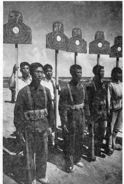
8 Nach jeder Schießübung werden die Schieß-Scheiben präsentiert.