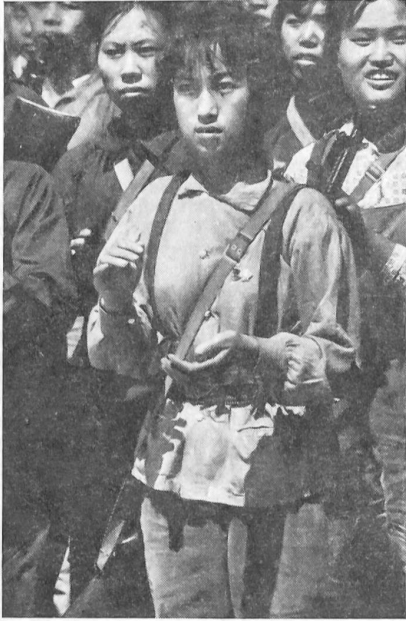
3 Eine Gruppe von weiblichen Miliz-Soldaten.