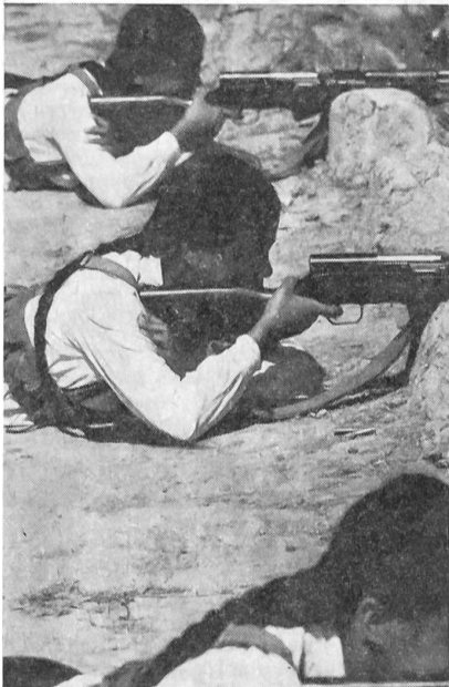
6 Diese beiden Mädchen sind Schwestern. Sie schießen auf 150-200 Meter Distanz und verfehlen ihr Ziel nie.