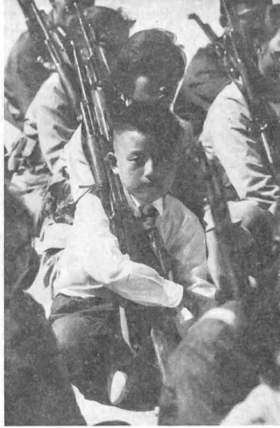
4 Kleine Jungen schon nehmen an den Uebungen der Miliz teil. Ihre roten Kra- watten kennzeichnen sie besonders.