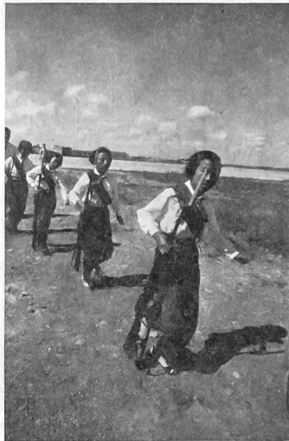
7 Laufschrift zur Schießübung.