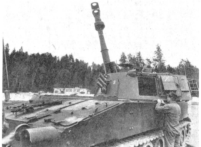
Die Panzerhaubitze M-109, mit welcher die Schlagkraft unserer Armee stark erhöht werden kann. Deutlich sind die groß dimensionierte Mündungsbremse und der Rauchabzug zu erkennen.