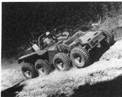
Müheles überwindet der Twister die schwierigsten Geländepartien.

Das Fahrzeug besteht aus zwei Teilen mit je vier Rädern, die über ein Gelenk miteinander verbunden sind. Der Twister bewältigt Steigungen bis 60 Prozent und kann Abhänge von 40prozentiger Neigung traversieren, ohne umzukippen.