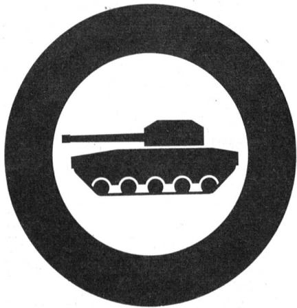
Verbot für Panzer