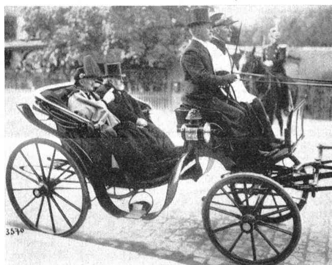
Kaiser Wilhelm und Bundespräsident Forrer auf der Berner Stadtrundfahrt zum Münster, zum Bärengraben und zurück zur deutschen Gesandtschaft, wo der Empfang des diplomatischen Korps stattfand.