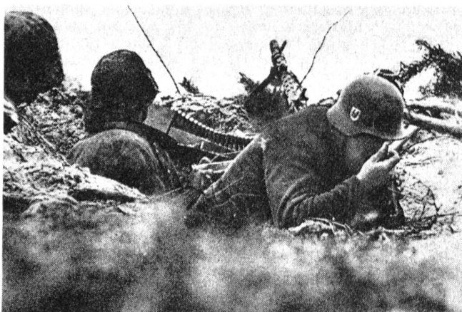
Die Verpflegung ist vorne angelangt. Ein Mg-Trupp zu 3 Mann (Gewehrchef, Schütze, Hilfsschütze) beim Verpflegen aus der Gamelle.

Beachte: Der Mann links außen, der gerade zum Sprung ansetzt, trägt eine russische Beute-Mp (PPS Mod. 41 mit dem typischen Trommelmagazin).