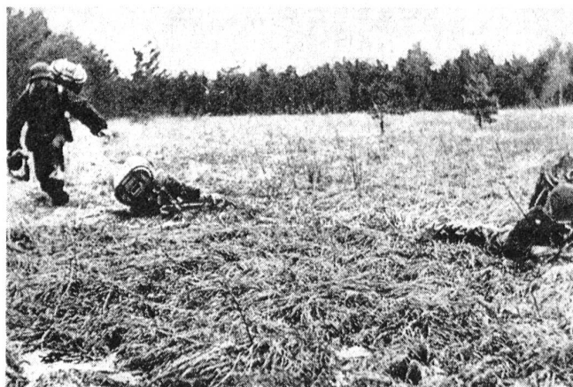
Der Trägertrupp hat Feuer erhalten und geht nun «Einzelsprungweise» vor.

Beachte: Der Mann links außen, der gerade zum Sprung ansetzt, trägt eine russische Beute-Mp (PPS Mod. 41 mit dem typischen Trommelmagazin).