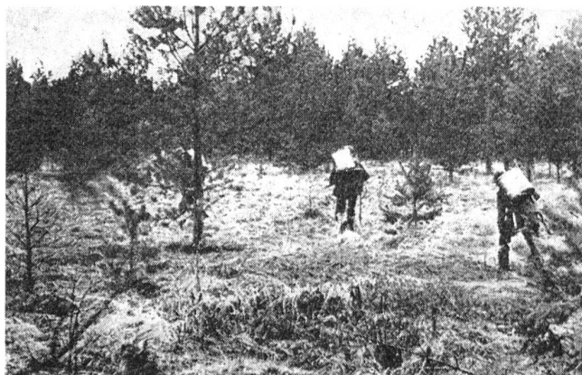
Trägertrupp im Vorgehen über eine Waldlichtung. Die gespannte Haltung der schwer beladenen Männer deutet darauf hin, daß die Lichtung vom Gegner eingesehen ist oder aber unter Störungsfeuer liegt (Artillerie, Minenwerfer).

Deutscher Trägertrupp bringt Verpflegungsnachschub nach vorne. Das stark bedeckte Gelände (Buschwald) erlaubt ein Vorbringen des Nachschubes auch bei Tag.