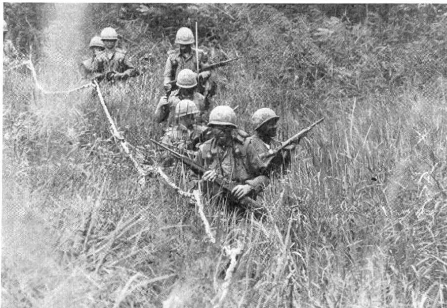
Krieg mottet an der koreanischen Waffenstillstandslinie

Tatsächlich, bei uns fliegen diese französischen Vögel auch. Da heisst es inskünftig aufpassen. Der französische Staatschef darf ja nicht verärgert werden, sonst dreht er uns plötzlich den Hahnen ebenfalls zu. In Israel sagt man neuerdings: «Celui qui a De Gaulle pour ami, n'a pas besoin d'ennemis.»