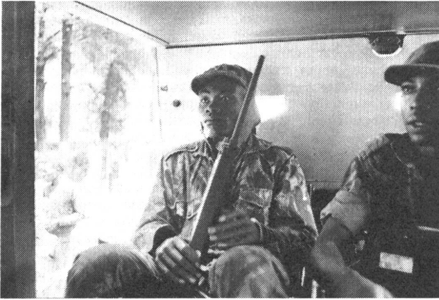
Angola: Eingeborene portugiesische Soldaten auf einer Draisine, die zum Schutze gegen Minen oder Sprengladungen vor den Zügen der Eisenbahn fährt