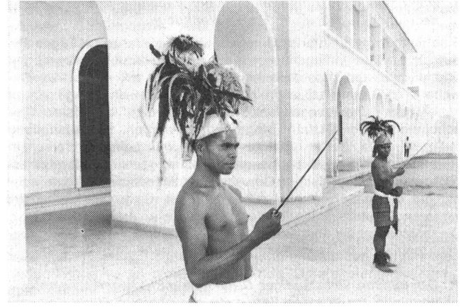
Timor: Die eingeborene Palastgarde des portugiesischen Gouverneurs