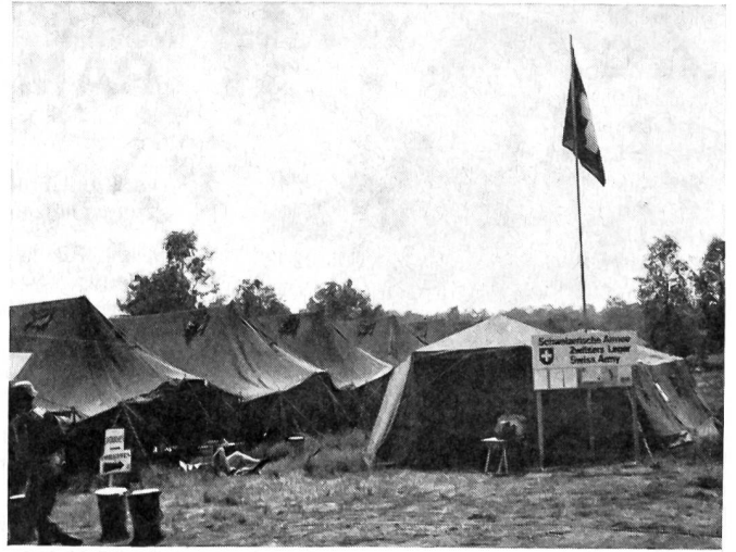
Das Schweizer Marschbataillon fand gastfreundliche Aufnahme im grossen Zeltlager ausserhalb der Stadt, das über Kantinen, Duschanlagen, eine Bank und andere Einrichtungen verfügte. Rund 8000 Soldaten aus 14 Armeen waren hier untergebracht.