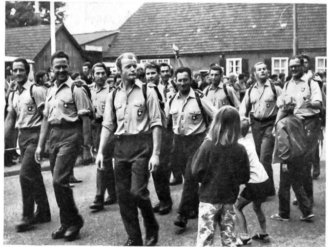
Marschgruppe der Stadtpolizei Bern.