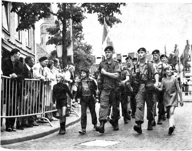
Marschgruppe der gut vertretenen kanadischen Armee.