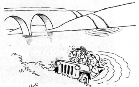
«... Aber Sie sagten doch selber, die Brücke sei als gesprengt zu betrachten!»

Kampfes liegt darin, dass sich die hierfür eingesetzten Truppen mit dem beschränkten Ziel der Verlangsamung des Gegners begnügen müssen; ihre Aufgabe ist nicht die kampffentscheidende Vernichtung des Gegners. Wohl sollen die Verbände, die diesen Kampf führen, den Angreifer schwächen, wo immer sich dazu Gelegenheit bietet. Aber diese Schädigung kann bestenfalls der Verlangsamung der Bewegungen des Angreifers dienen; für einen Entscheidungsschlag fehlen meist die Mittel. Die Kampfmethodik der Verzögerungskräfte ist auf die besondere Zielsetzung dieser Taktik des Unterlegenen ausgerichtet. Ein nachhaltiger Kampf muss von ihm vermieden werden; einen solchen vermöchte er auch kaum zu bestehen. Vor dem Gegner muss darum ausgewichen werden. Im Gegensatz zur reinen Verteidigung wird somit das Gelände nicht bis zum letzten gehalten; vielmehr wird vor dem feindlichen Stoss planmässig von Stellung zu Stellung ausgewichen, so dass es nicht zum Nahkampf kommt. Verzögerungskämpfe werden deshalb weiträumig von beweglichen Verbänden geführt, die in