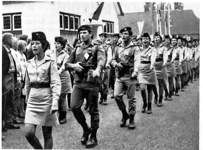
Einen guten Eindruck hinterliessen die Israelis, die ihre tägliche Wegstrecke im gleichen Schritt und Tritt absolvierten und unterwegs mit viel Beifall empfangen wurden.