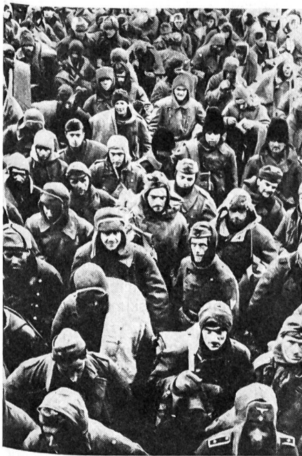
Eine Kolonne Stalingradgefangener, bestehend aus deutschen und rumänischen Soldaten