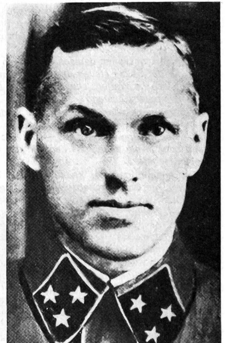
Generalleutnant K. K. Rokossovskij, Oberbefehlshaber der «Donfront»

Voronov fragte bei Stalin nach. Am 4. Januar 1943 erhielt er die Genehmigung. Er musste einen Entwurf zur Durchsicht und Bestätigung vorerst nach Moskau schicken. «Die ganze Nacht arbeitete ich an dem Entwurf. Ich hatte erstmalig mit einer derartigen Sache zu tun», schreibt Voronov, und er hat auch recht. Seit Beginn des deutsch-russischen Krieges war erstmalig die Lage entstanden, dass die Russen aus der Position der Stärkeren den bedrängten Deutschen diktieren konnten. Das Ultimatum geben wir deswegen in seinem Wortlaut wieder, da es auch im Laufe des weiteren Fortganges des Krieges stets dasselbe Schema hatte und aller Wahrscheinlichkeit nach auch heute noch als Vorlage zu ähnlichen Aufforderungen dienen kann: