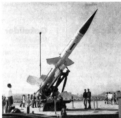
Schweizer Bloodhound Mk 2 an einer Ausstellung in Emmen

Bei diesem Scharfschiessen wurden drei «Bluthunde» auf unbemannte Zielflugzeuge abgefeuert. Alle drei Lenk Waffen erfüllten ihren Auftrag zur vollen Zufriedenheit unseres Versuchsteams. In dem Einsatz, wo es vorgesehen war, das Zielflugzeug zu zerstören, wurde dies erreicht.