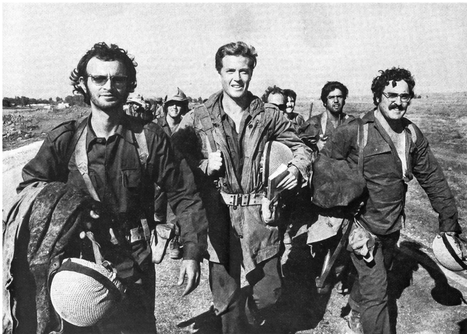
Israelische Reservisten an der syrischen Front.

Im Rückblick auf die vergangenen Oktobertage erkennt man die Richtigkeit des israelischen Begehrens nach sicheren Grenzen und versteht auch die hartnäckige Weigerung, sich von den Waffenstillstandslinien von 1967 zurückzuziehen, bevor ein wahrer, ehrlicher und dauerhafter Friede abgeschlossen ist. Ein an den Grenzen von 1948 mit der Übermacht von 1973 ausgelöster Angriff Ägyptens und Syriens hätte unter den Voraussetzungen vom Oktober den Krieg unweigerlich nach Israel hineingetragen. Er wäre unendlich viel blutiger und zerstörender gewesen und hätte die endgültige Auslöschung Israels bedeuten können, weil Zahal es im Gegensatz zu 1967 unterlassen hatte, mit einem Präventivschlag im letzten Augenblick dem drohenden arabischen Ansturm zuvorzukommen. Übrigens hat kein vernünftiger Mensch den arabischen Führern das postulierte Kriegsziel 1973: «Befreiung der von Israel besetzten Gebiete» zum Nennwert abgenommen. Wäre den Aggressoren in diesem Zweifrontenkrieg der erhoffte Durchbruch und der Stoss nach dem israelischen Kernland gelungen, hätten sie wohl kaum vor der Staatsgrenze angehalten.