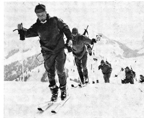
Eine der ausgezeichneten Marschgruppen der deutschen Bundeswehr.