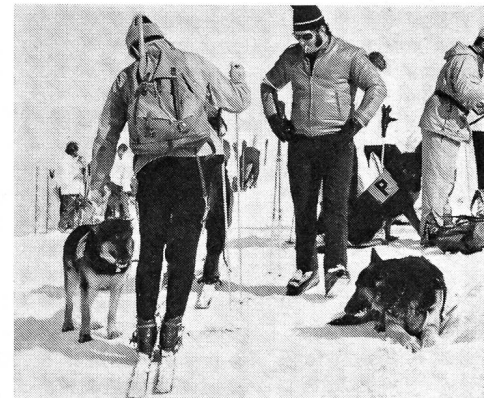
Gruppe der Berner Kantonspolizei mit ihren Lawinenhunden auf dem höchsten Punkt des ersten Marschtages, dem Gandlauenengrat.