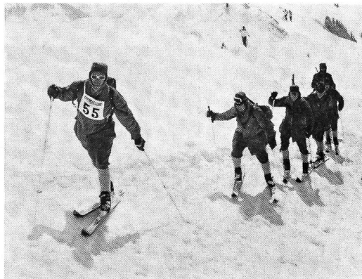
Patrouille des Wiener Jägerbataillons Nr. 4.