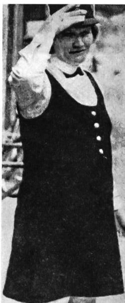
Ein Umstandskleid zur Dienstuniform entwickelten dänische Militärschneider. Anlass dazu gab die Schwangerschaft einer Berufsmatrosin der Königlich Dänischen Kriegsmarine, die zu einer neuformierten Einheit von Marinehelferinnen gehört. In der dänischen Marine dienen überwiegend Berufssoldaten. Hinzu kommen 2000 männliche und 1000 weibliche Freiwillige der Marine. A. B.