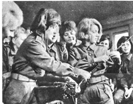
Polnische Mädchen an der Fakultät «Militärisches Wissen» an der Warschauer Universität. Sie werden als Radiotechnikerinnen für die Armee ausgebildet.