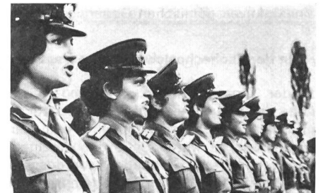
Die ersten weiblichen Offiziere der Rumänischen Volksarmee wurden im Oktober 1973 ausgemustert. Sie werden nicht nur im Territorialdienst verwendet, sondern auch beim Heer und in der Luftwaffe.