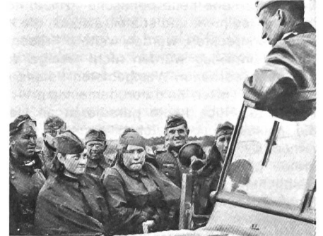
Ein deutscher Hauptmann unterhält sich mit gefangenen weiblichen Offizieren der Roten Armee (Sommer 1941).