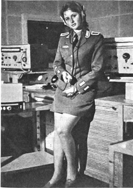
Weibliche Angehörige der DDR-Armee.