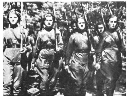
Frauenbataillon der Polnischen Volksarmee 1943.