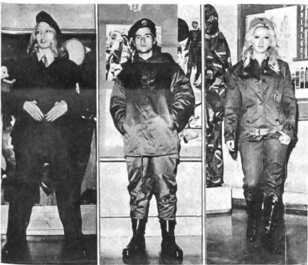
Mädchen in Uniformen des jugoslawischen Territorialdienstes. Die Uniformen haben einen westlichen Schnitt.