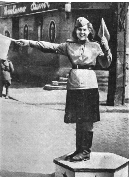
Russische Verkehrsreglerin in einer eroberten deutschen Stadt (1945).