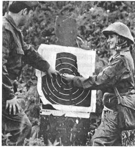
Die Ausbildung in der NVA schliesst auch Schiessübungen ein.