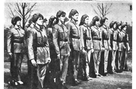
Manöver der Patriotischen Garden in Rumänien. Eine Fraueneinheit übt sich im Schiessen.