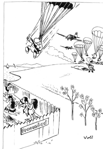
«Grenadier Oetiker . . . !!!»

Ziffer 15 DR 67 (Neuaufgabe 1971) bezeichnet als Höhere Stabsoffiziere: Oberstbrigadier, Oberstdivisionär, Oberstkorpskommandant und bestimmt unter Ziffer 236, dass diese Gradinhaber anzureden seien mit Brigadier, Divisionär und Korpskommandant. Also kennt auch unser Dienstreglement zwei Versionen. Da ich meine, dass zwischen Schreibweise und Anrede kaum