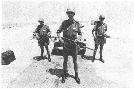
Blauhelme im Sinai

Angehörige des aus verschiedenen Nationen zusammengesetzten «Peace-Keeping-Corps» wachen im Sinai und auf dem Golan über die Einhaltung des Waffenstillstandes.