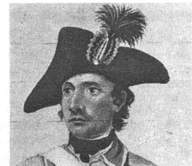
«Christian Reichenbach, Wachtmeister der Berner Zuzüger» an der Grenze, 1792. Aus einer aquarierten Zeichnung von Franz Niklaus König. Kunstmuseum Bern.