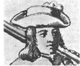
Aufgeschlagener Filzhut für einen Soldaten, um 1728. Aus einem, von Johannes Greuter zu Roggwil gestifteten Glasfenster. Histor. Museum Bern.