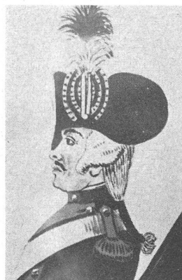
Zweispitz, 1792. Aus einem Aquarell von Marcus Heusler, bezeichnet «Zuziger von Abt St. Gallen. Ein Gemeiner vom ehemaligen Regiment Châteauvieux, jetzt von Compagnie Barthès vom Abt.» Kokarde: von innen gelb – schwarz – gelb – schwarz – gelb – schwarz. Federbusch: unten gelb, oben schwarz.