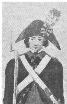
Zweispitz eines Füsiliers, 1792. Aus einem Aquarell von Paul Usteri, bezeichnet «Aus der alten Landschaft St. Gallen». Gänse gelb. Kokarde wellenförmig gefaltet, von unten nach oben: schwarz – gelb – schwarz – gelb – schwarz – gelb. Federbusch: unten weiss, oben rot. Ehemalige Sammlung Jenny-Squeder. (Vgl. auch «Schweizer Soldat» Nr. 7, 8 und 9 vom 15. und 31. Dezember 1967 sowie 15. Januar 1968.)