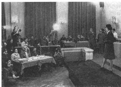
Ein Blick in den Saal, in dem die Modeschau stattfand. Links die aus drei Frauen bestehende Jury.

Drei weibliche Parlamentarier nahmen an dieser Arbeitssitzung teil.