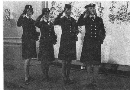
Ausgangsuniformen Tenues de sortie

Trois parlementaires féminins assistaient à cette séance de travail.