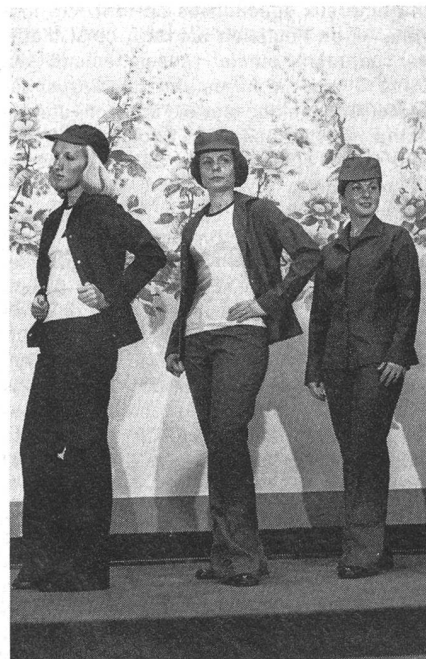
Arbeitsuniformen Tenue de travail

Une vue de la salle où se déroule le défilé — à gauche trois juges féminins prononceront le verdict.