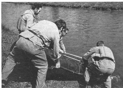
Auf in die «Ersatzaare»