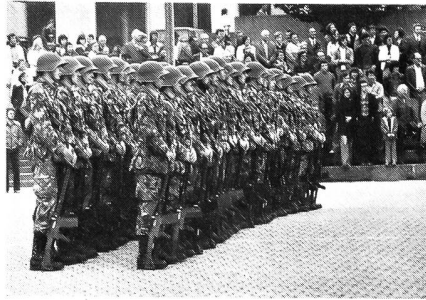
Zu Beginn des «Tags der offenen Tür» wurde den rund 2000 Besuchern mustergültige Zugschule demonstriert.