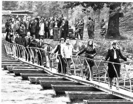
Es ist zwar eine ordentlich wackelige Sache, der von den Rekruten über die Reuss erstellte Steg 58, aber er hält!