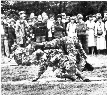
«Lueg au deet, wie'n euse Jung zuepackt!»