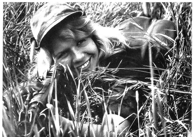
besonders für die Fotografen.