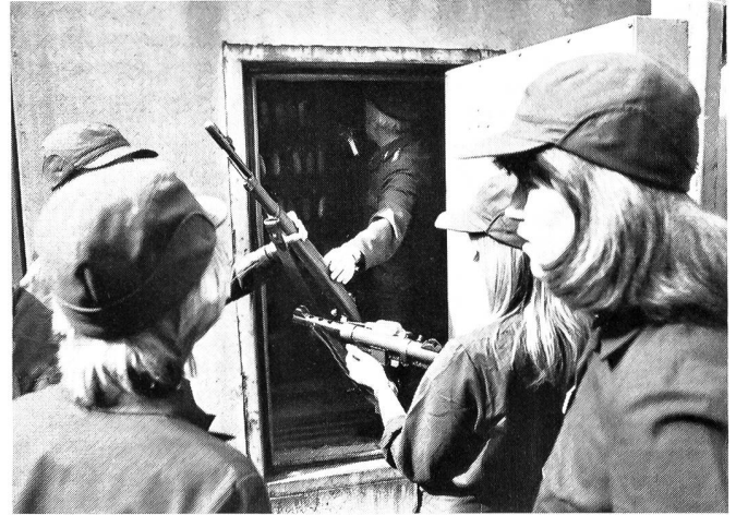
und Waffe gefasst.