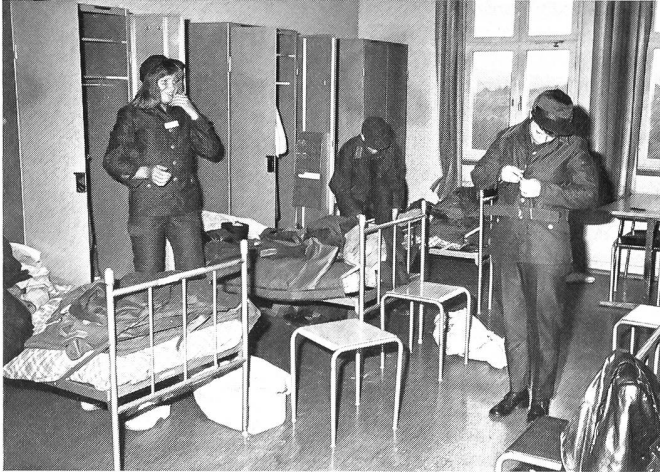
Zuerst werden Uniform ...

In Schweden wird eifrig darüber diskutiert, ob auch Frauen in die Streitkräfte aufgenommen werden sollen. Versuchsweise ist nun zum erstenmal ein «Armee-Lager für Mädchen» durchgeführt worden. Weitere Lager, organisiert von den Landstreitkräften, der Luftwaffe und der Marine, sollen folgen. Die ersten Erfahrungen, sowohl von seiten der Teilnehmerinnen als auch der Organisatoren, scheinen positiv zu sein.