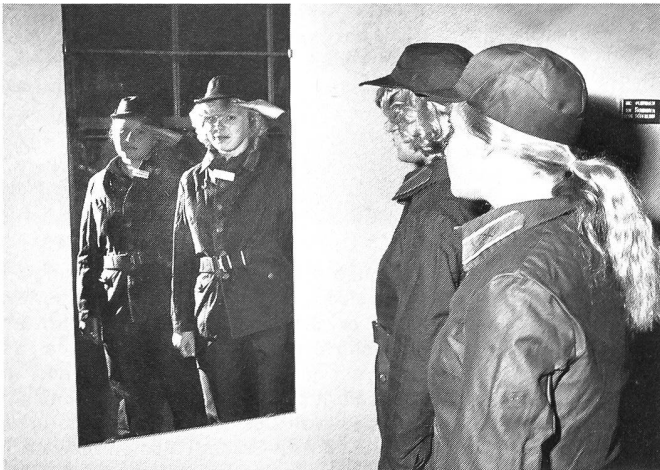
Das Grüßen ...