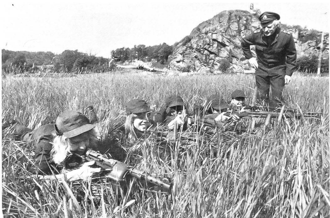
Frauen mit Waffen — immer spektakulär ...