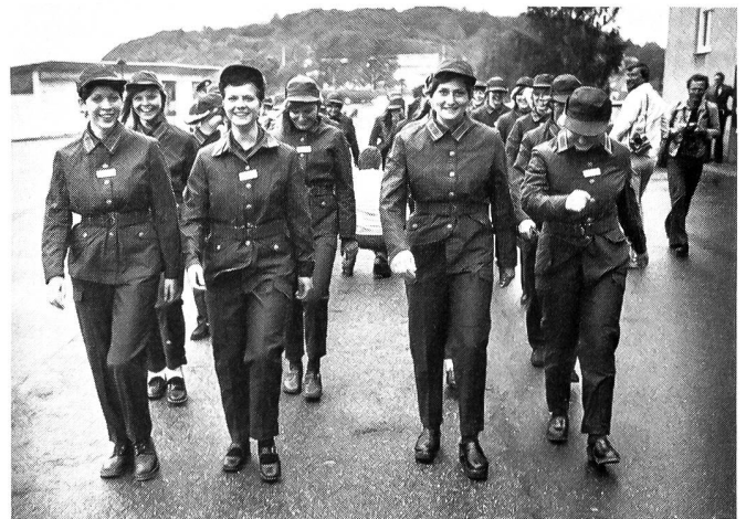
und das Marschieren im Schritt scheinen auch für schwedische Mädchen nicht ganz leicht zu sein.