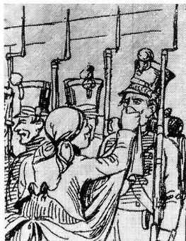
«I muss däich Häisin gahn d'Schnore putzen.» Aus einer Federzeichnung von H. von Arx im Bernern «Guckkasten».