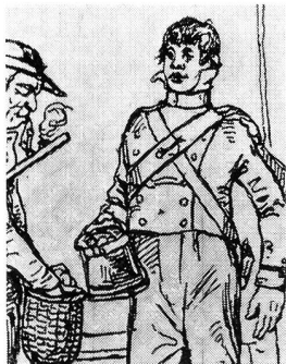
«Wie Hans zum erstenmal in der Garnison ist und Besuche empfängt.» Der Vater hat ihm von zu Hause Eier mitgebracht. «Garnison» war der in der Hauptstadt stattfindende Wiederholungskurs. Aus einer Federzeichnung von Heinrich von Arx im Bernern «Guckkasten».