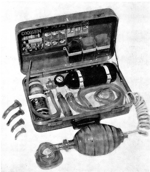
Erste-Hilfe-Koffer, Modell Modulaide Oxygen Jet