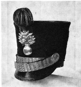
Tschako eines Artillerieoffiziers, von 1818 bis 1835. Vergoldete Granate. Rotes Pompon mit einem Büschel vergoldeter Fransen. Ehemalige Sammlung R. Bossard.