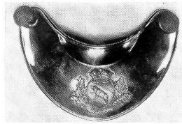
Ringkragen oder Haussecol, messingvergoldet, mit aufgeschraubtem Staatswappen, 1834. Prinz Louis Napoléon, der spätere Kaiser Napoleon III., wurde 1834 in Thun zum bernischen Artilleriehauptmann ausgebildet und brevetiert. Musée des Armes et Armures, Bruxelles.